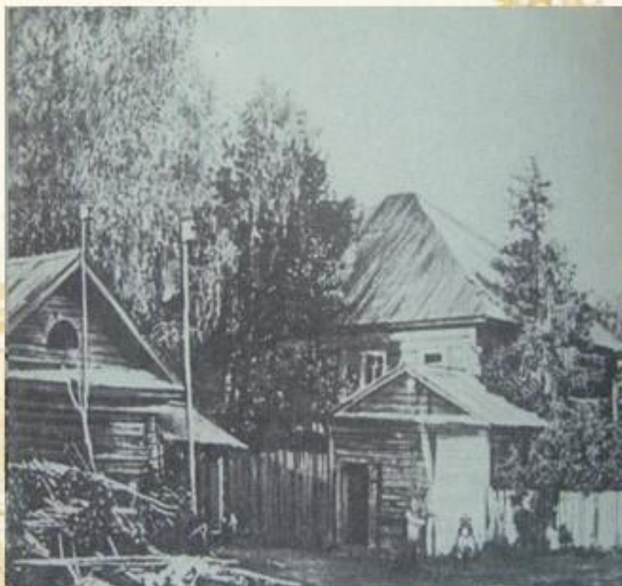
Остатки усадьбы Бальмонтов в Гумнищах. Фото 1960-х годов.