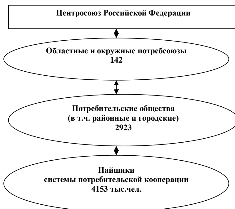
Рис 1. Организационная структура Центросоюза РФ

На протяжении более десяти лет Правительством РФ и Государственной Думой ФС РФ было принято более десяти различных законов и Федеральных программ. Все они связаны с деятельностью потребительской кооперации, на которую возложена большая социальная ответственность. Большим событием в экономической жизни России стало принятие Доктрины продовольственной безопасности. Система потребительской кооперации принимает активное участие в ее выполнении (рис. 1).