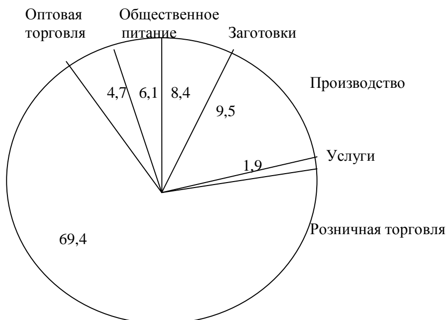
Рис. 2. Удельный вес отраслей системы потребительской кооперации Центросоюза России в совокупном объеме деятельности за 2010г.