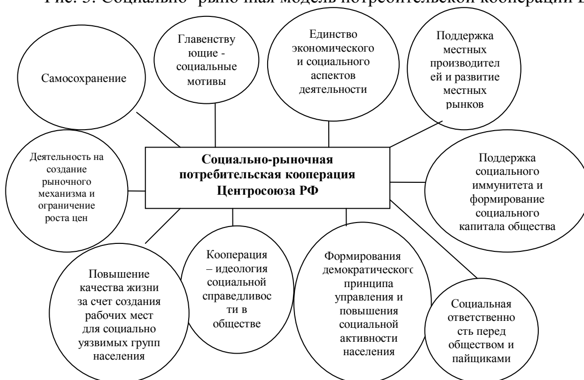
Рис. 5. Социально-рыночная модель потребительской кооперации ЦС РФ

Кооперативы сегодня могут сделать значительный вклад в развитие Болгарии, России, чтобы поднять болгарскую и российскую экономики и превратить их в процветающие державы. Значение потребительской кооперации в современных условиях состоит в том, что она представляет образец организации социального рыночного хозяйства. Благодаря основополагающим принципам деятельности, она вносит вклад в экономическое и социальное развитие, в создание гражданского общества (рис. 5).