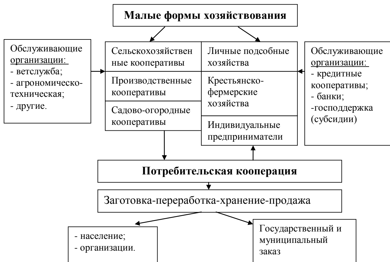
Рис 4. Логистическая инфраструктура по работе с малыми формами хозяйствования

6. Почти во всех европейских странах с переходной экономикой государство способствует кооперативной деятельности, осознавая значение кооперативов как для развития национальной экономики в переходный период, так и для интеграции национальных экономик в мировое хозяйство. Так, правительство Венгрии на требование международного кооперативного движения приняло закон, который содействует деятельности сберегательных и кредитных кооперативов, поскольку это отвечает нормам ЕС.